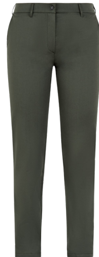
102 Verde militare